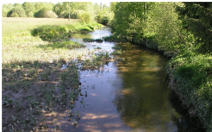
Le Saint-Nicolas à Fousse-magne

Un Contrat de bassin concrétise un partenariat, d'ordre technique et financier, entre porteurs de projets locaux (intercommunalités, associations, usagers, etc.) et financeurs (agence de l'eau, régions, départements...).