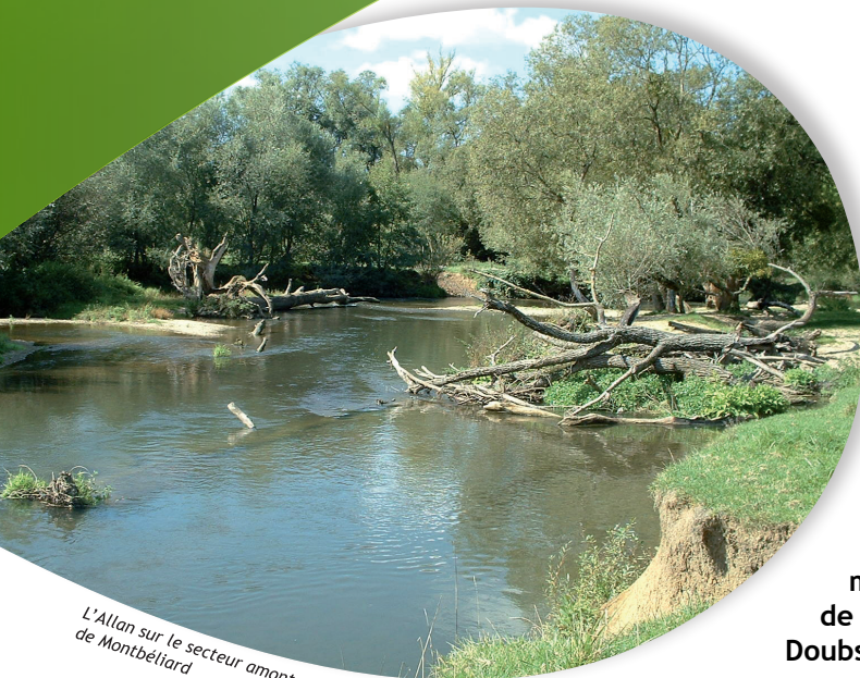
L'Allan sur le secteur amont de Montbéliard

Les 45 actions prévues au contrat permettront d'améliorer l'état de la ressource, des milieux aquatiques et de la biodiversité qui en dépend, et de porter l'attention sur la nécessité de préserver notre or bleu.